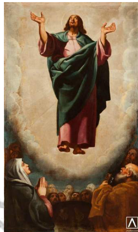
Ascensión 1619 Vicente Carducho