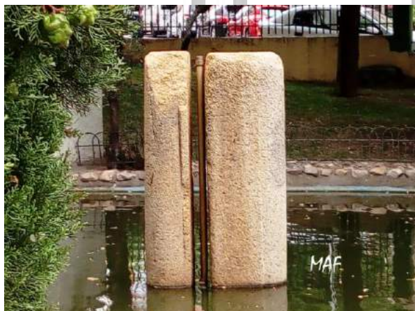
Columnas adosadas del Balcón del Cristo en el Parque de los Olivos. Algete Fotografía realizada por MAF el 13 julio 2019

A mediados de los años 60 se tapió con una valla en la que aparecía en grandes letras el famoso “RESERVADO PARA NUEVO AYUNTAMIENTO” hasta la construcción del Ayuntamiento actual, inaugurado en 1974, ya que anteriormente estuvo en la parte principal de la actual Biblioteca Municipal.