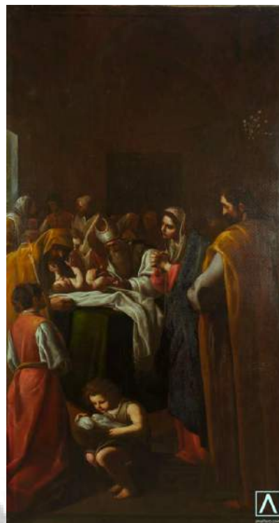
Circuncisión 1619 Eugenio Cajés

Las pinturas y parte del retablo, se empezaron a limpiar y restaurar en los años 70, continuando con algunas intervenciones esporádicas en años posteriores. En agosto de 2015 se extrajeron las pinturas del retablo ya que se intervino en la restauración de la mazonería del mismo, dejándolas en el antiguo baptisterio. Meses antes se retiró y restauró de forma más completa el cuadro “Adoración de los Reyes Magos” de Vicente Carducho que se expuso temporalmente en la Real Academia de San Fernando, en la exposición “El triunfo de la imagen” (20 febrero – 12 abril 2015) organizada por la Dirección General de Bienes Culturales de la Comunidad de Madrid. En 2016 se realizó una limpieza y restauración de todas las pinturas para volver a sus respectivos espacios en el retablo.