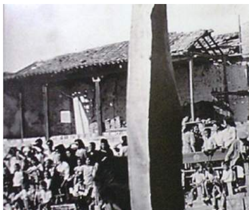
Balcón del Cristo. Fragmento fotografía de 1946 en Exposición Historia Algete (2003). Colección J y C. Peluqueros, original Sra. Vitoria

El “Balcón del Cristo” era, como aparece definido en un documento, “un corredor o balcón en la plaza”, es decir unas gradas cubiertas abiertas como una gran balconada a la plaza, desde donde se podían disfrutar de los festejos y actos que se celebraban en la misma, con barandilla de madera.