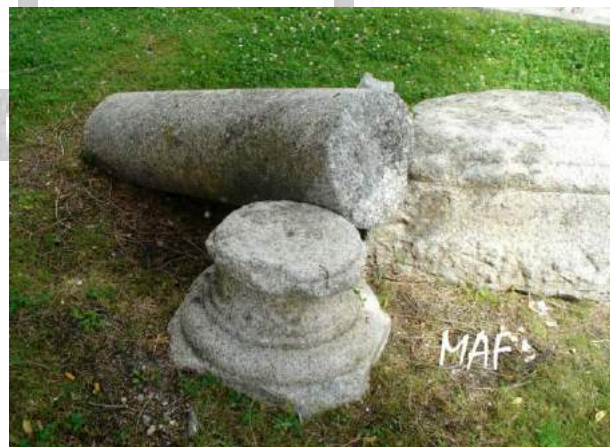
Bases y Columna del Balcón del Cristo en el Cementerio. Algete Fotografía realizada por MAF el 13 julio 2019

Al construir el nuevo Ayuntamiento y acondicionar el solar, las columnas, bases y capiteles se trasladaron a la puerta del sol y después a otros lugares como el Parque Los Olivos, donde vemos dos piezas en el centro del estanque y otras que estaban por entre los olivos. Allí fue donde hicimos la foto del capitel con la fecha 1619 el 2 de abril de 1991 y que no hemos vuelto a localizar. Esas otras piezas se trasladaron y podemos ver en el cementerio y en el espacio ajardinado de la calle Miguel de Unamuno junto a la rotonda de Valderrey en el que además vemos una base de columna interesante que estuvo a la entrada del cementerio.