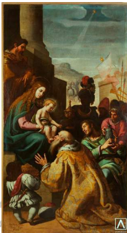
Adoración de los Reyes Magos 1619 - Vicente Carducho