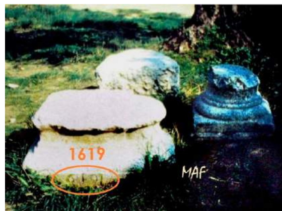
Capitel invertido fechado en 1619 junto a restos de bases y columnas en el Parque de los Olivos. Algete el 2 abril 1991