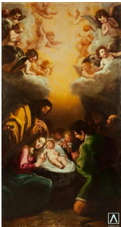
Adoración de los pastores 1619 Vicente Carducho