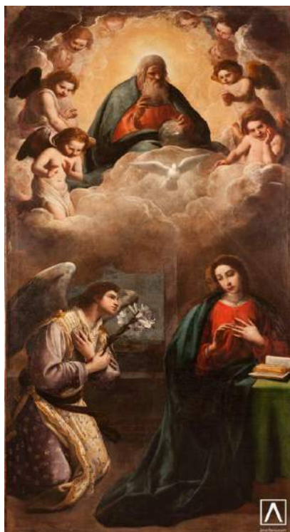
Anunciación 1619 Eugenio Cajés Fotografía J.M.Alfaro 2016