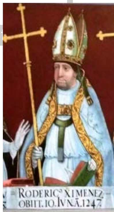
Rodrigo Jiménez de Rada – Catedral de Toledo