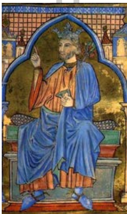
Fernando III, rey – Miniatura Catedral de Santiago

Con la información, el conocimiento y la participación de todos los habitantes de esta Comunidad de las Once Villas, es como este VIII Centenario tiene su sentido, sintiéndonos todos de esta tierra e historia común. Se iniciaron las celebraciones en Talamanca en enero 2023 y cada mes se van continuando en cada una de las once villas con distintos actos.